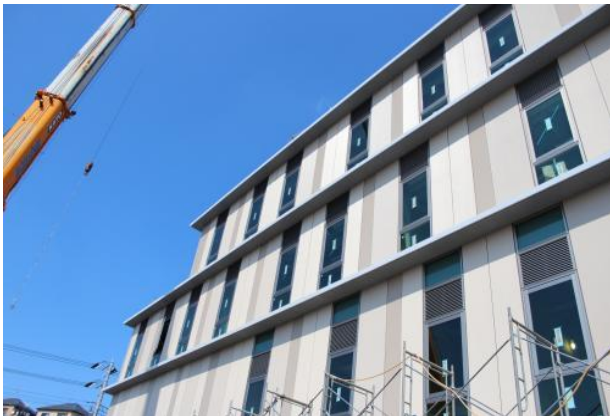
覆いと足場がとれました。(平成 26 年 4 月 24 日)