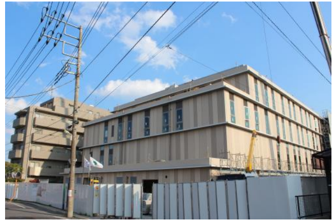
北側から見た三和病院

編集後記 :新緑の美しい季節を迎えました。緑が日ごと変化していきます。春から初夏へのこの時期は、生命の息吹が力強く感じられます。病院の建物も一日で大きく変化しています。外壁の覆いと足場が取り払われ、外観が見えるようになりました。木立をイメージした設計で、リズムカルに窓が配置されています。日中は木漏れ日のようにガラスがきらきら光るでしょう。夜には暖かい明かりが燈るでしょう。木々の緑が濃くなるころには、いよいよ三和病院がオープンします。地域の方々に安心という木陰を提供できるよう真摯に努力し、患者さんがご自分の健康と人生を大切にできる地域づくりに貢献したいと思っています。病院オープンまでのカウントダウンはあと 90 日。今月号の「かなえ」では今までの様子を写真で追ってみました。みんなの力で病院が出来ていくのがわかります。開設準備室から(クリニックの上のマンション)病院の建物が見えるんです。毎日見えています！総務:中野三代子