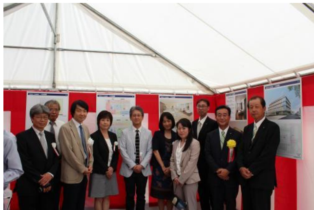
地鎮祭(平成25年8月29日)