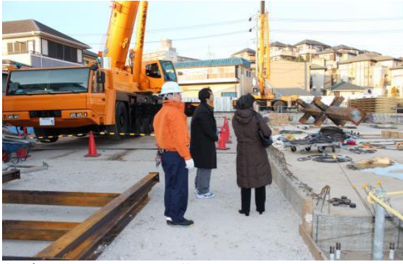
何度も現場を訪れて夢をふくらませるドクター陣