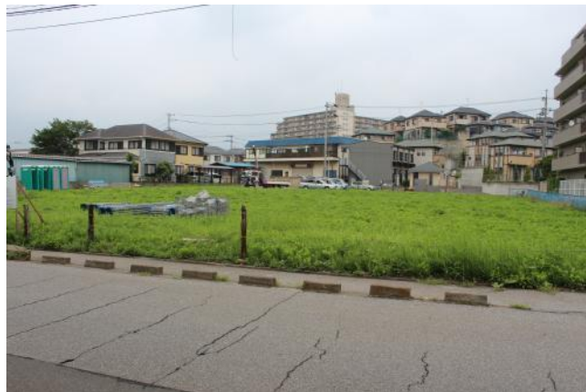
南側道路から見た 建設前の予定地

平成25年8月から始まった病院の建築。今までの様子を時間順に写真でご紹介します。昨年の今頃は、何も無い空き地でしたが、地盤改良から始まり、くい打ち・・・鉄骨建て方、外壁張り、内装・・・と工事はどんどん進んでいきます。鼎会・大成建設さん・関連業者さん、みんな真剣に良いものを造ろうと取り組んでいます。