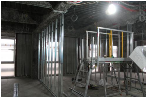
内装もどんどん進みます。