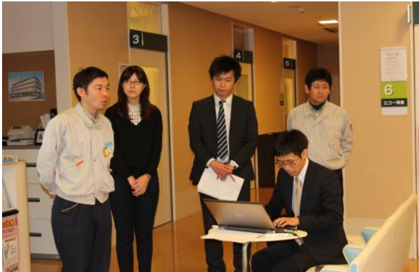
大成建設さんによる全体会議での説明。