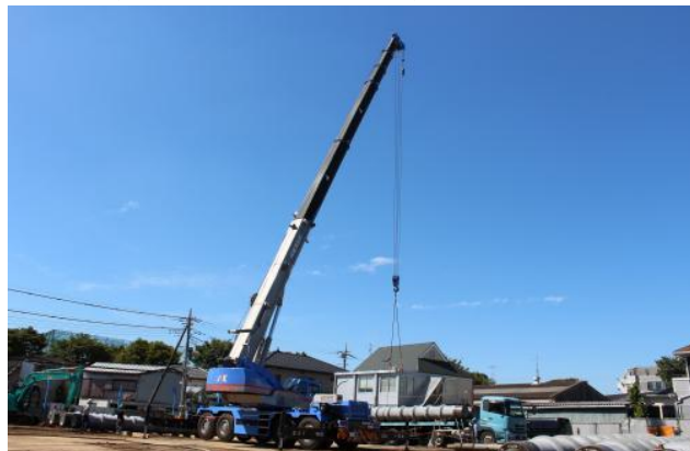
くい打ち始まる(平成25年9月17日)