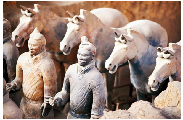
※等身大で作られた兵馬俑の身長は180cm前後、重量は300kg以上

嬴政は13歳という若さで秦の国王となりますが、その前から中国統一の夢を持っていたといいます。幼少時代に人質として敵対国の趙で辛酸をなめるような冷遇を受けて育ったことがその動機といわれています。