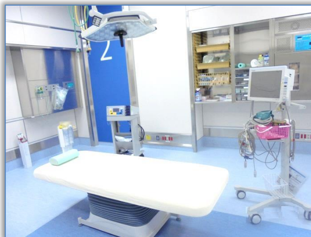
【手術室2(局所麻酔用)】

全身麻酔を受ける患者さんは、術前に手術室担当看護師が、手術室での流れを説明させて頂いたり、手術や麻酔に対する不安を少しでも軽減できるよう術前訪問に伺っています。