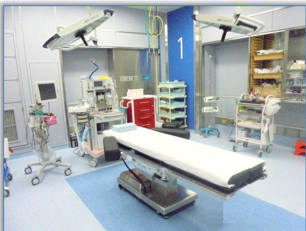
【手術室1(全身麻酔用)】

全身麻酔の手術室内風景です。全身麻酔は、主に乳腺外科や消化器外科の手術で行っています。手術室内は、音楽をかけたたり掛け物を温めて用意し、リラックス効果につながるよう努めています。